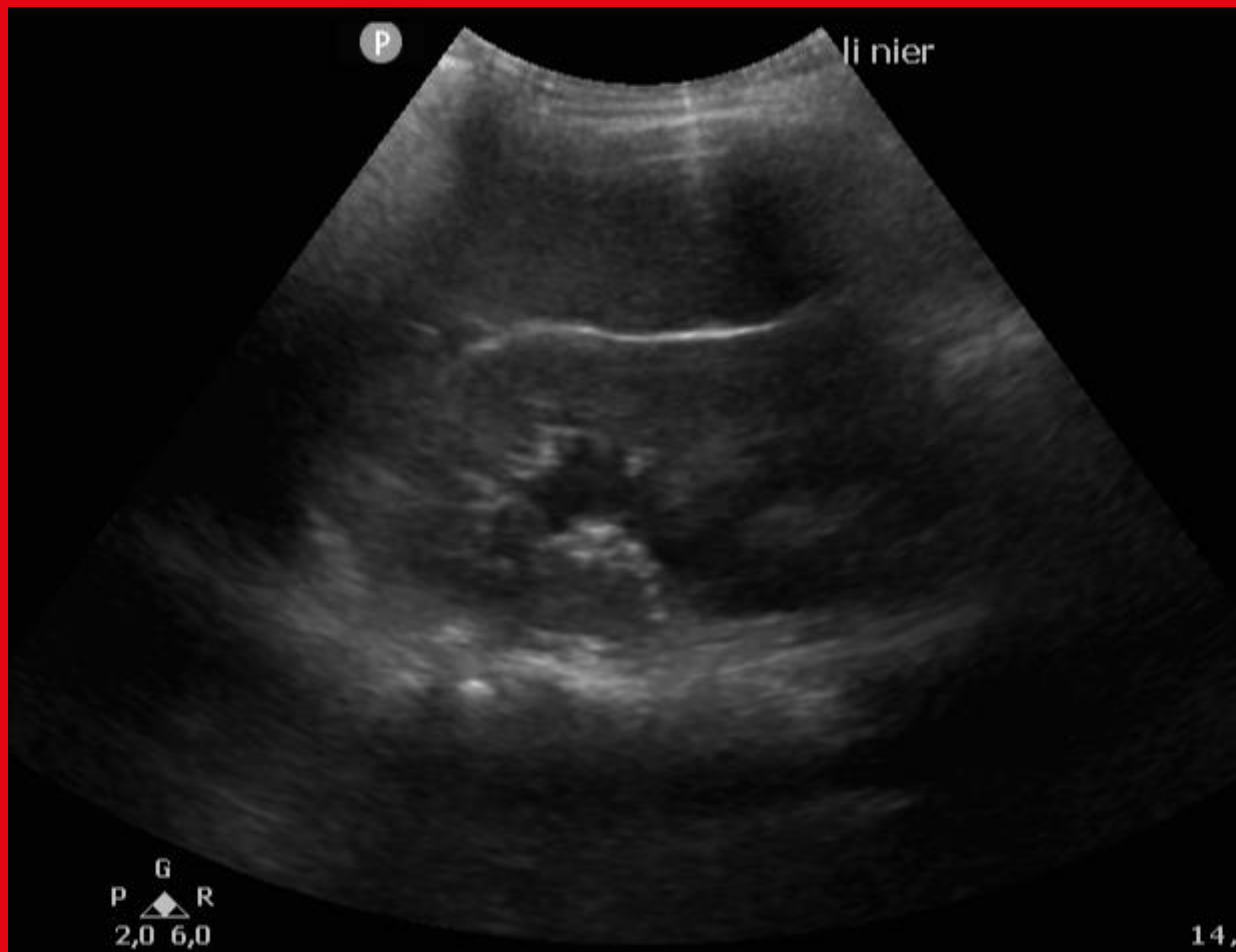
Figuur 1: nier links