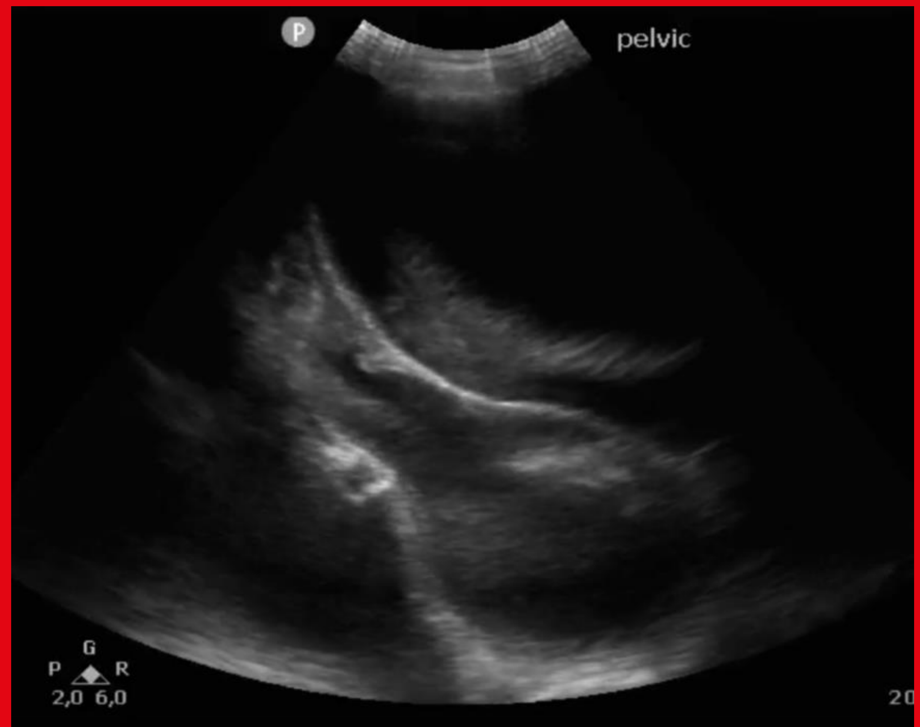
Figuur 2: kleine bekken